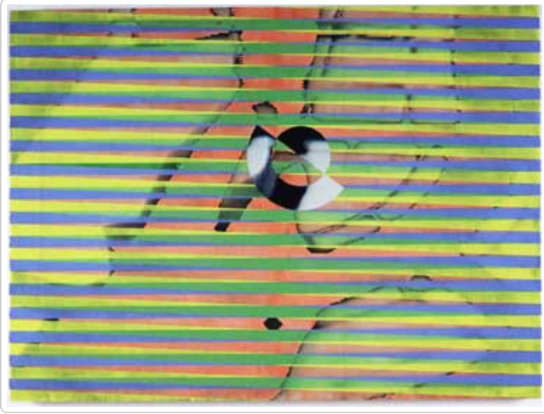
[Mario Côté, Sortir de l'ombre , 1999, acrylique sur bois, 83,5 x 114 cm, collection Loto-Québec]

Mario Côté, Sortir de l'ombre . Le motif de cette acrylique sur toile est difficile à décoder. Son intérêt principal repose sur le jeu de lanières qui traverse l'oeuvre en zig-zag. Les couleurs des lignes alternent entre le jaune et le bleu. Le mélange de ces teintes, comme tout jeune enfant colorant un soleil sur un ciel bleu le sait, nous donne du vert pur. Ce sont donc des teintes de vert et de rose qui s'ajoutent aux croisées des lanières principales. L'ensemble produit un rythme étourdissant.