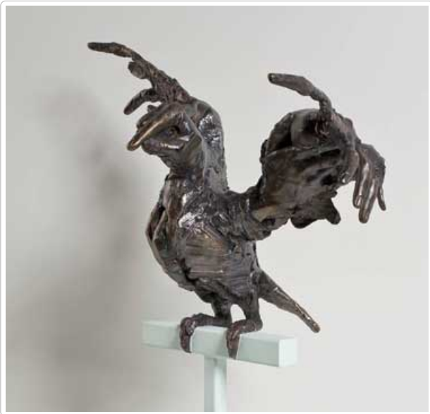
[David Altméjd, Hand Bird I , 2007, bronze sculpté, 12/15, 99 x 71 x 37 cm, collection Loto-Québec]

Mario Côté, Sortir de l'ombre . Le motif de cette acrylique sur toile est difficile à décoder. Son intérêt principal repose sur le jeu de lanières qui traverse l'oeuvre en zig-zag. Les couleurs des lignes alternent entre le jaune et le bleu. Le mélange de ces teintes, comme tout jeune enfant colorant un soleil sur un ciel bleu le sait, nous donne du vert pur. Ce sont donc des teintes de vert et de rose qui s'ajoutent aux croisées des lanières principales. L'ensemble produit un rythme étourdissant.