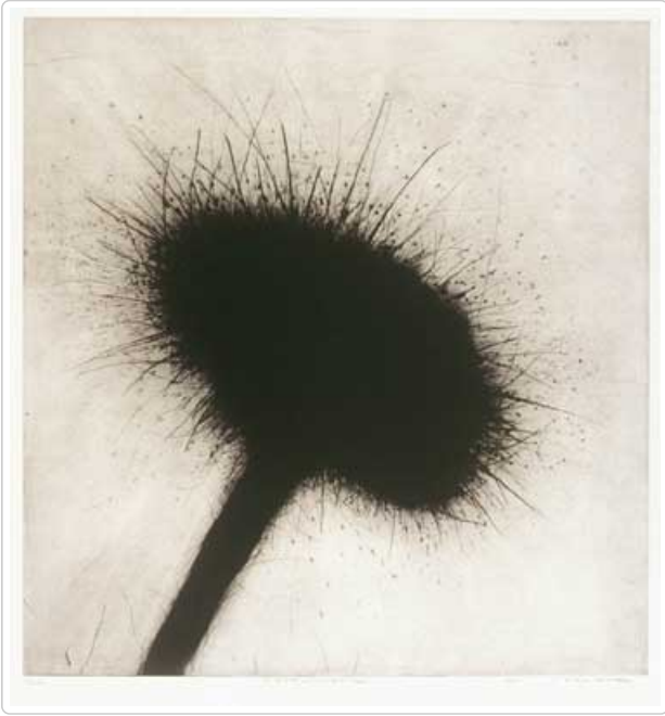
[Ludmila Armata, Régénération , 1994, estampe, eau-forte et pointe sèche, 120 x 79 cm, collection Loto-Québec]

Existe-t-il un discours nouveau créé par cet espace d'exposition? Peut-être. La mise en relation des oeuvres entre elles est unique. Dans la troisième cellule, le thème de la végétation est évoqué par la juxtaposition de l' Herbier de Monique Mongeau, Régénération de Ludmila Armata, Linéament le glacier d'Aletsch I d'Eveline Boulva et Neufs moulages pléthoriques de Stephen Schofield. Dans cette cellule, on est entouré de rappels de montagne, de plantes, de vent, de vie.